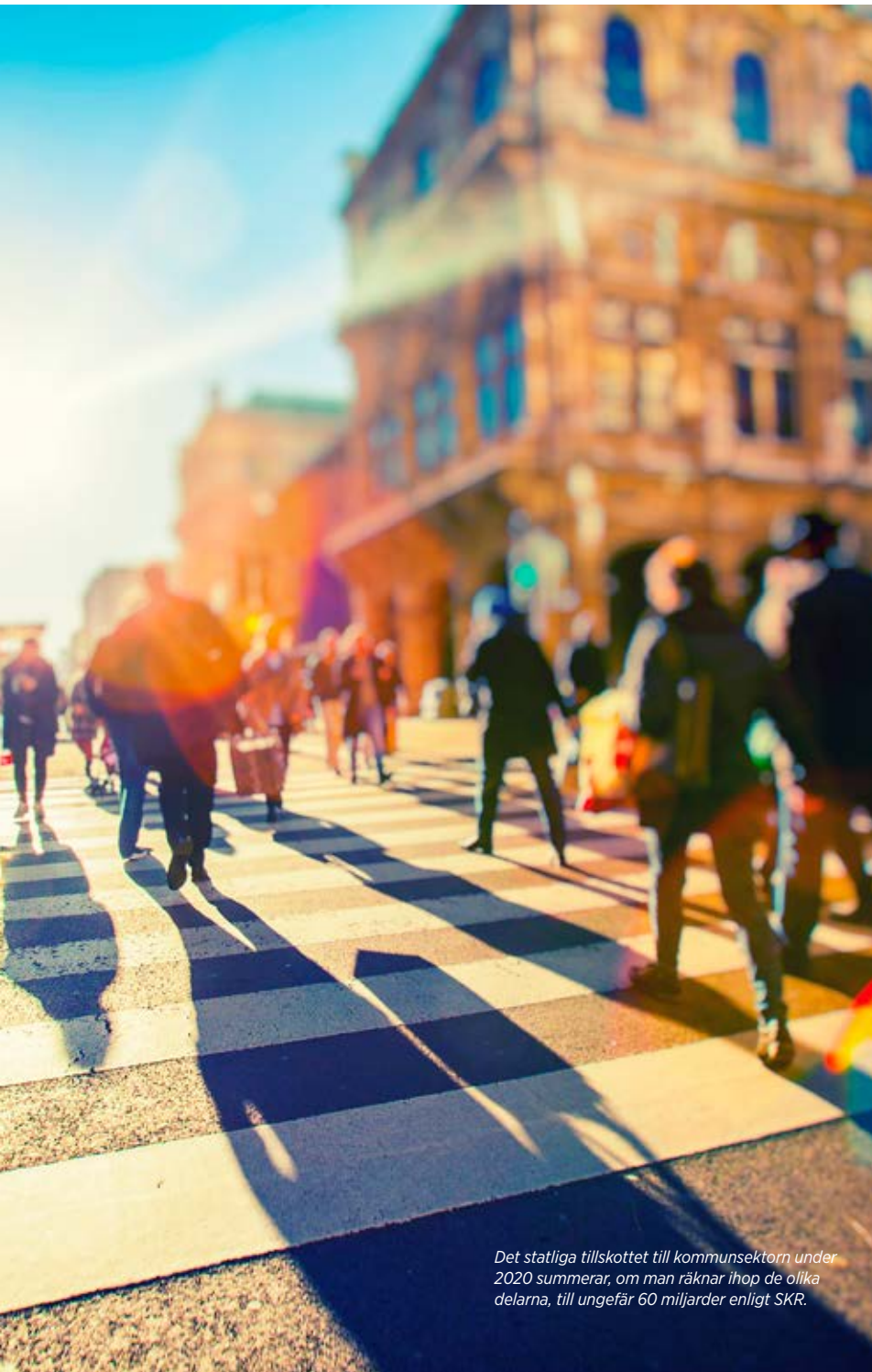
Det statliga tillskottet till kommunsektorn under 2020 summerar, om man räknar ihop de olika delarna, till ungefär 60 miljarder enligt SKR.