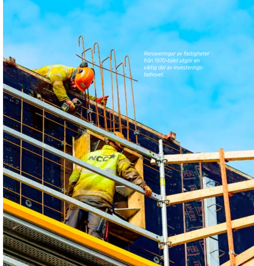
Renoveringar av fastigheter från 1970-talet utgör en viktig del av investeringsbehovet.

M ånga fruktade att 2020 skulle bli ett tufft år för kommunsektorn, men när året närmar sig sitt slut är bilden delvis den omvända.