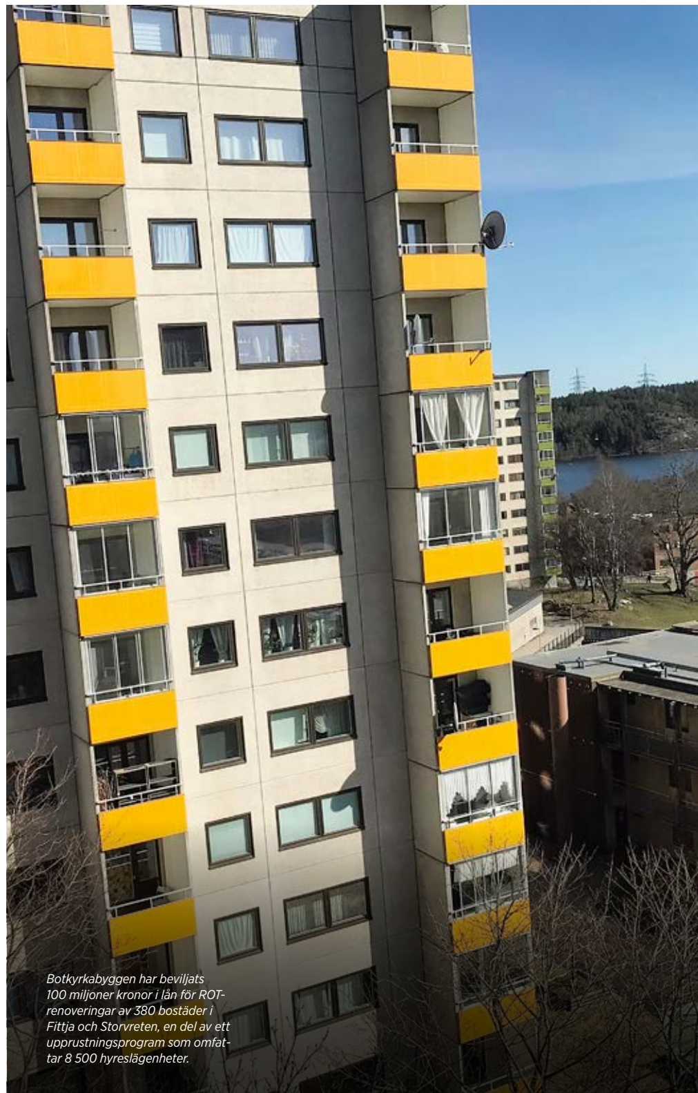
Botkyrkabyggen har beviljats 100 miljoner kronor i lån för ROT-renoveringar av 380 bostäder i Fittja och Storvreten, en del av ett upprustningsprogram som omfattar 8 500 hyreslägenheter.